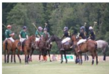
Die Polo-Teams treten jeweils mit vier Spielern an.